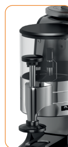
Foto: CAIMANO-II con Pressino telescopico (accessori) Photo: CAIMANO-II with telescopic tamper (accessories)